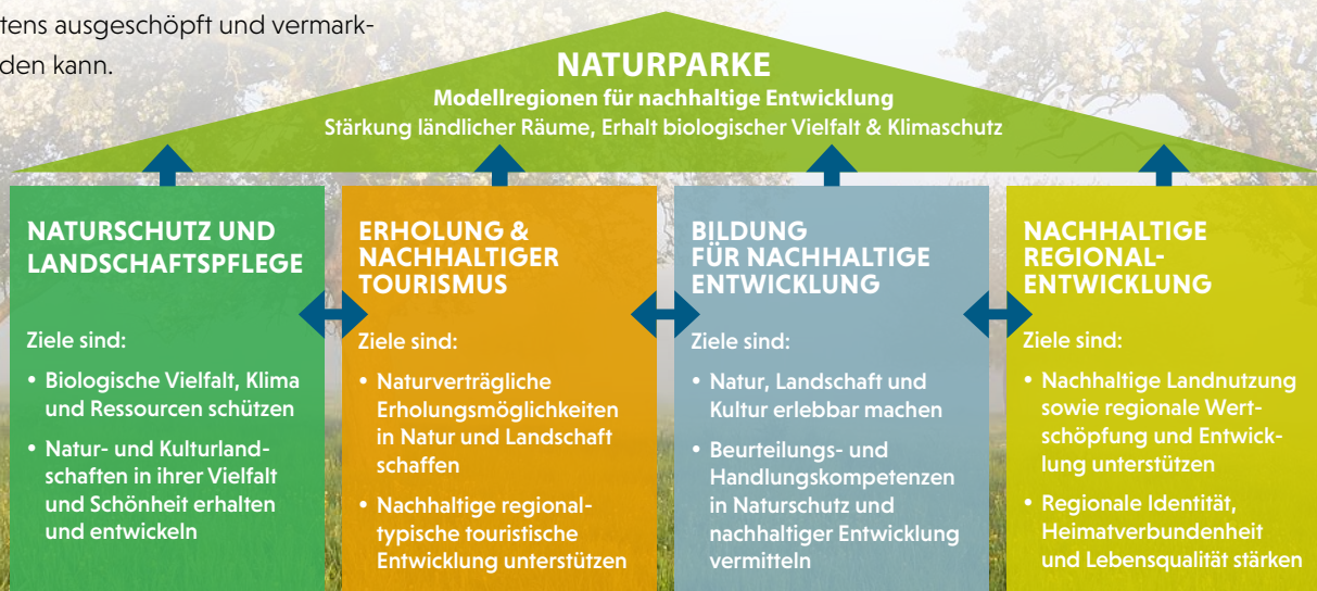
Abbildung verändert auf Grundlage des Wartburger Programms der Naturparke in Deutschland (VDN, 2018)

Der Verband Deutscher Naturparke legte mit dem Wartburger Programm seine bundesweit abgestimmten Ziele und Aufgaben der deutschen Naturparke vor. Auf dieser Grundlage und in Verbindung mit dem Bundesnaturschutzgesetz richten die Naturparke ihre Aktivitäten an den vier Handlungsfeldern Naturschutz, Erholung, Bildung und Regionalentwicklung aus.